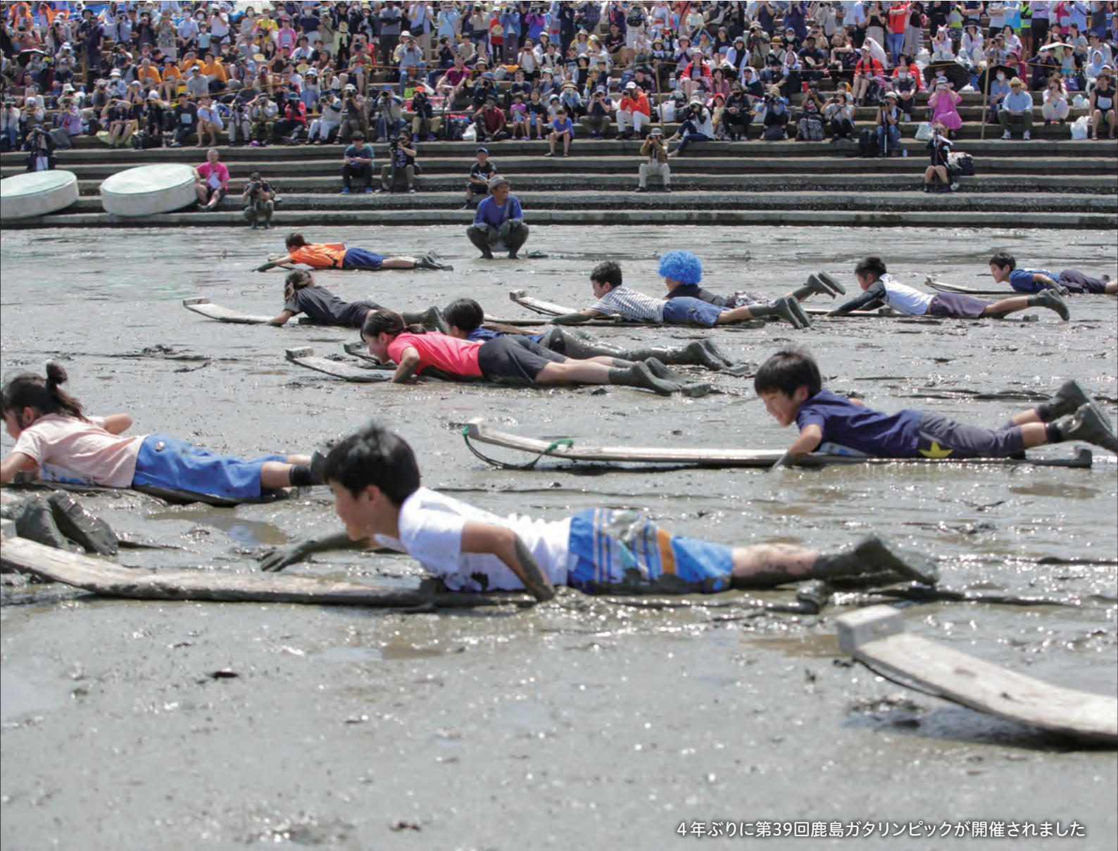
4年ぶりに第39回鹿島ガタリンピックが開催されました

Kashima Chamber of Commerce and Industry