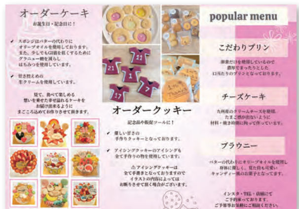
(↑写真：一緒に作成したリーフレット)