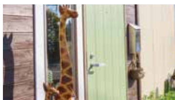
▲オープン時の合図である「キリン」の置き物