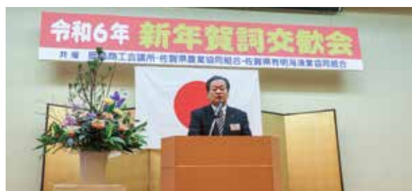
▲主催者代表の挨拶

令和6年の新年を寿ぐ新年賀詞交歓会(鹿島商工会議所・佐賀県農業協同組合・佐賀県有明海漁業協同組合共催)を、去る1月4日(木)割烹清川にて開催いたしました。今回は4年ぶりに出席者の制限を設けず飲食を伴う開催となり、鹿島市の発展を祈念し市内外から約210人の参加があり、和やかに参加者同士の新年の挨拶が交わされました。