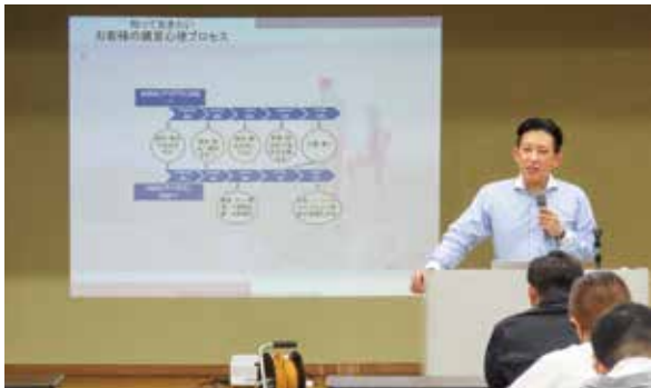
▲昨年の創業塾風景